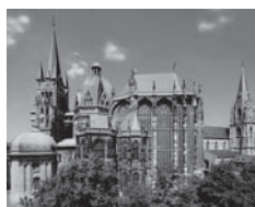
Aachener Dom