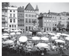
Marktplatz im Sommer