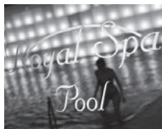
Royal Spa Badewelt

Sollte Interesse bestehen, geben Sie bitte Ihre Telefonnummer bei der Anmeldung auf der letzten Seite an. Wir rufen Sie zurück.